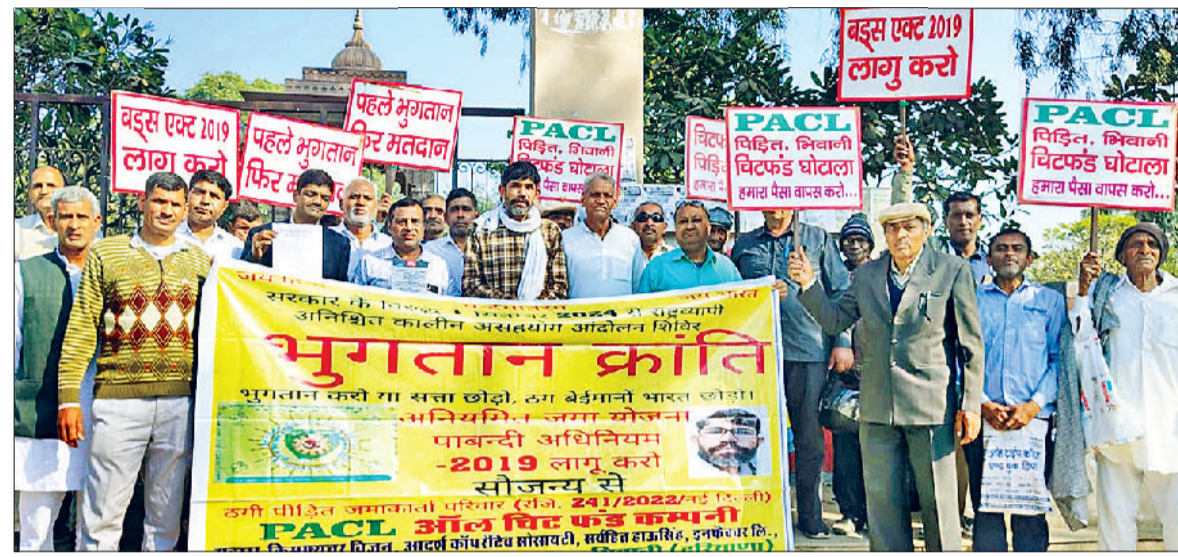
भिवानी। चित फंड कंपनियों व सरकार के खिलाफ प्रदर्शन करते पीड़ित निवेशक।