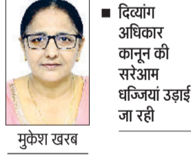
दिव्यांग कर्मों अपने आपको हाशिए पर पाता है, वह दिव्यांगता तथा असमानता के दोहरे पर खड़ा होकर अपना जीवन व्यतीत करता है। वह भेदभाव से पैदा होने वाली बाधाओं का सामना करता है। इन तुगलकी फरमानों को दिव्यांग विरोधी ठहराया गया है तथा वापस लेने की मांग की है। दिव्यांग कर्मियों के सेवा अधिकारों की रक्षा करते हुए पुनः सेवानिवृत्ति उम्र 60 वर्ष की जाए।