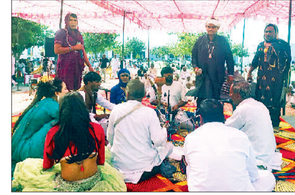
भिवानी। अमर प्रेम हीर रांझा का मंचन करते कलाकार।