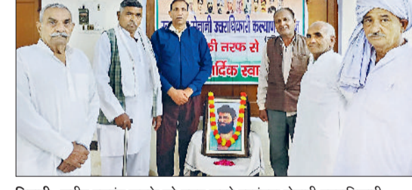
भिवानी। शहीद बलवंत फड़के को नमन करते स्वतंत्रता सेनानी उत्तराधिकारी कल्याण संगठन के सदस्य।