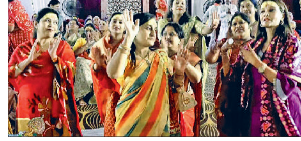
भिवानी। श्रीमद्भागवत कथा में झूमती श्रद्धालु।